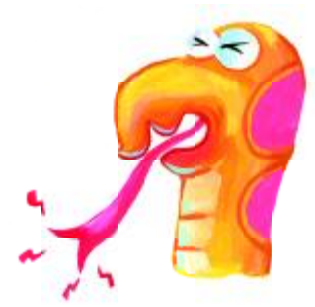
งูเป็นแผลร้อนใน