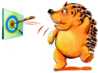
เอาไว้เล่นเกมปาเป้า