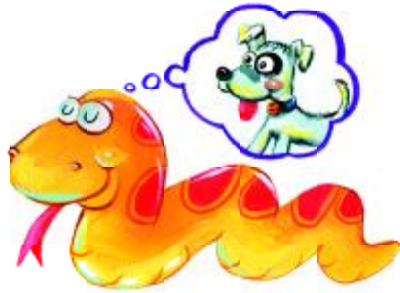
ลื้อเลียนเจ้าตูบ