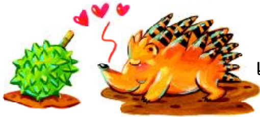
เพราะตกหลุมรักกับทุเรียน