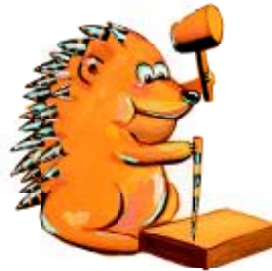
เม่นใช้หนามแทนตะปู