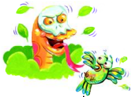
ชอบแกล้งให้คนอื่นตกใจ