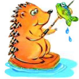
ใช้เป็นฉมวกแทงปลา